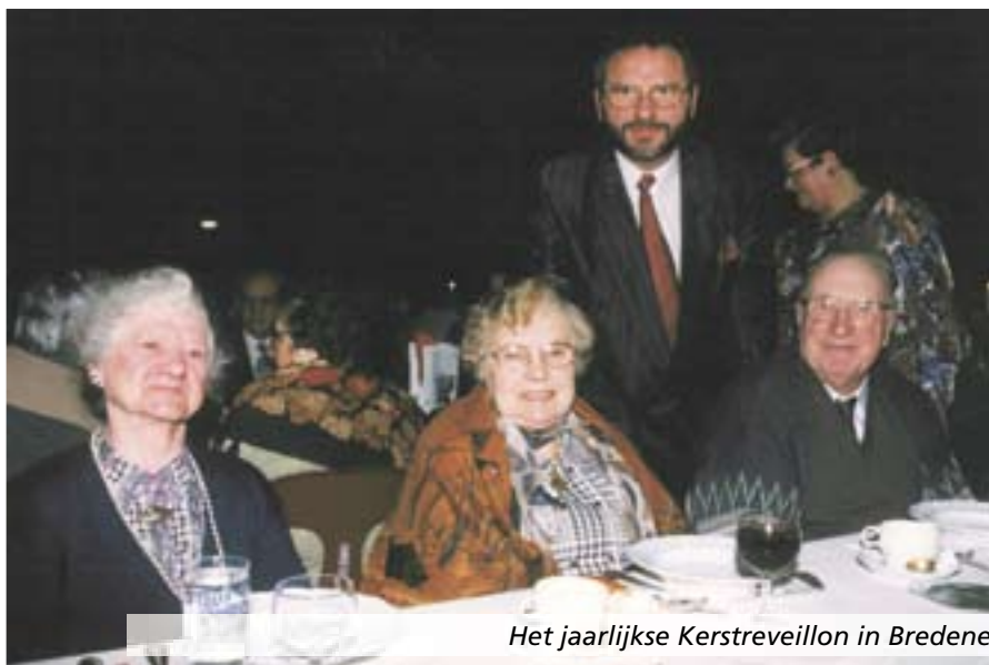
Het jaarlijkse Kerstreveillon in Bredene