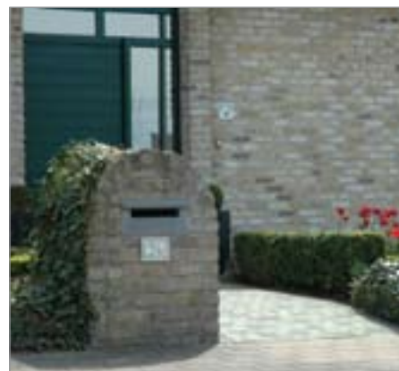
brievenbus geïnstalleerd is vóór 1 januari 2008.