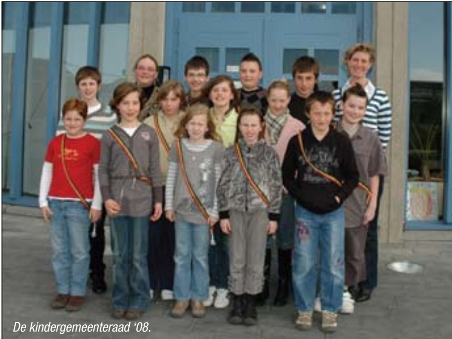
De kindergemeenteraad '08.