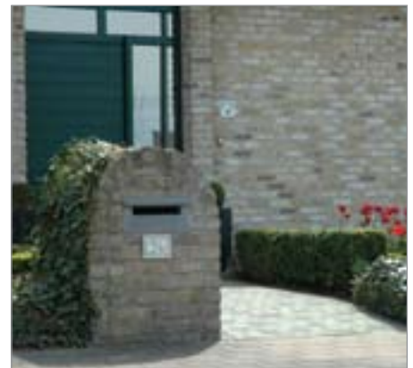
brievenbus geïnstalleerd is vóór 1 januari 2008.