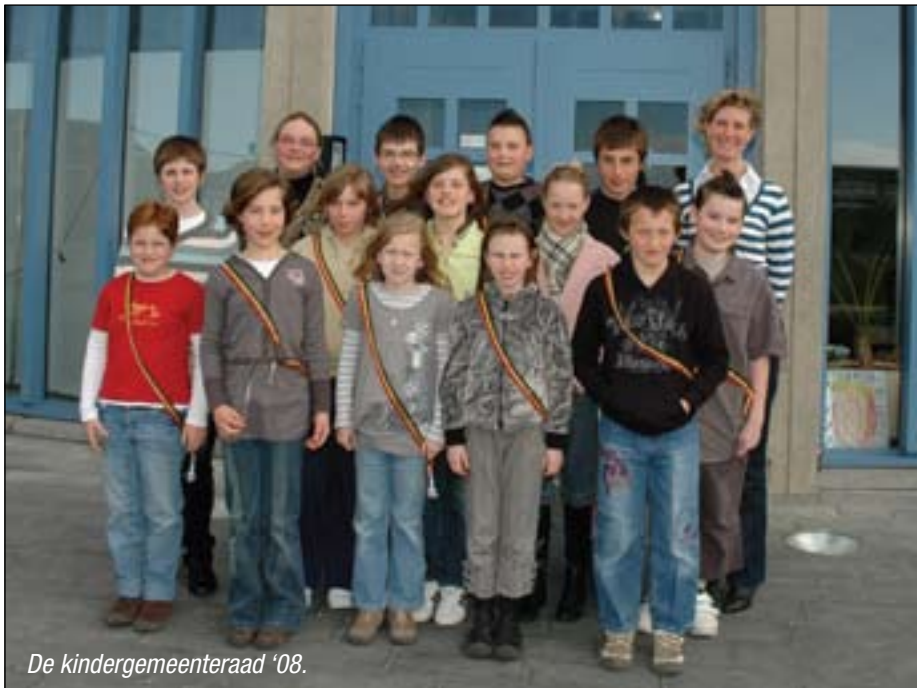
De kindergemeenteraad '08.